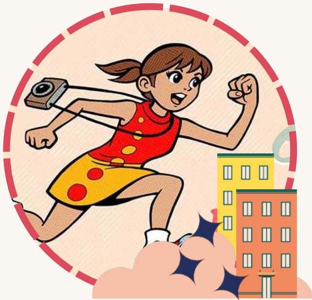
Marathon Photo du 7 ème Concours photo 13 juin · 10h-17h · Prix libre