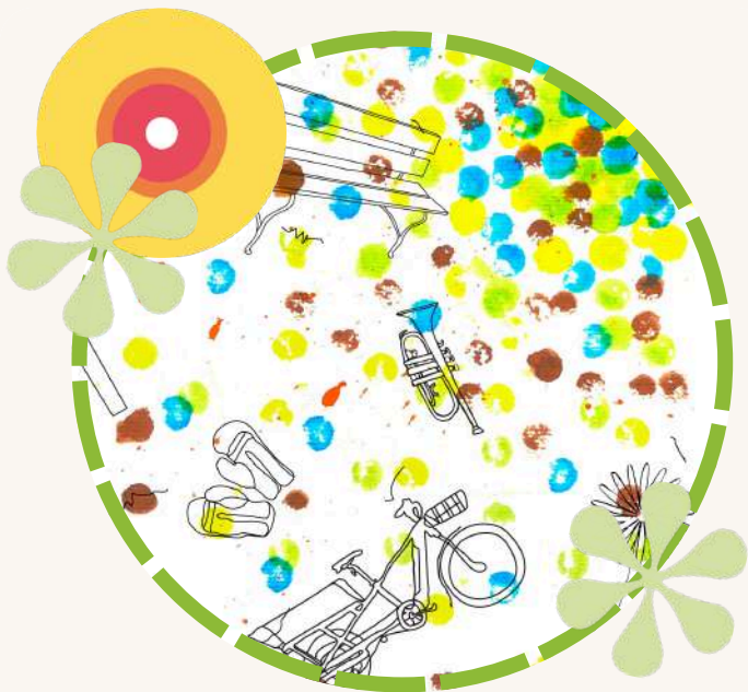
Éclats de Rue Fête de quartier 6 juin · 10h-12h & 16h-22h