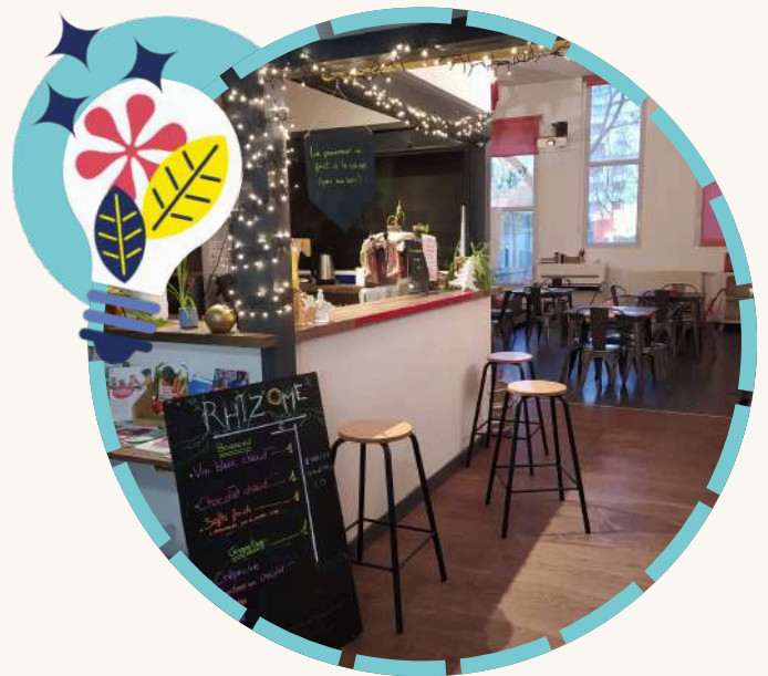
Anecdotes Gesticulées Spectacle 9 juin · 19h