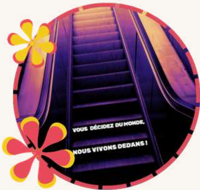
Théâtre d'impro avec le CLAP Spectacle 10 juin · 19h · Prix libre