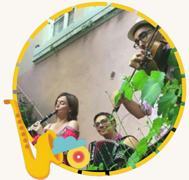
Verkamikos Concert 16 juin · 19h · Prix libre