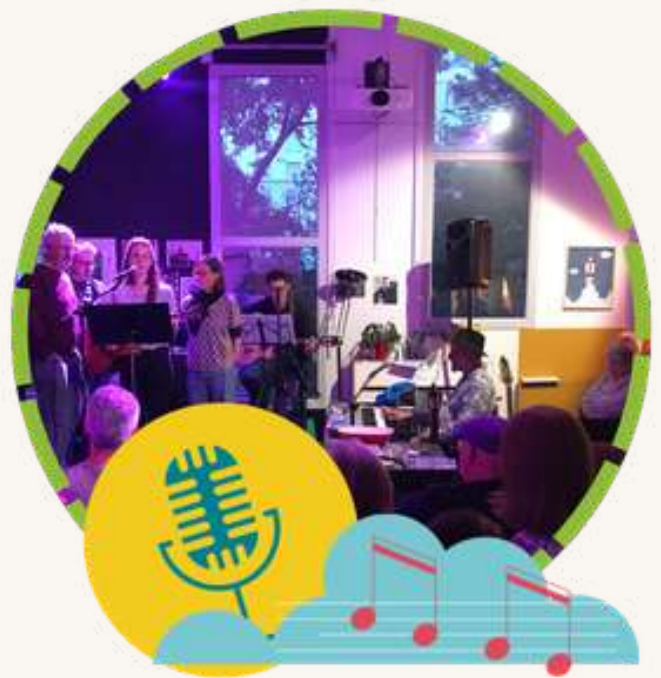
Les années 80's Concert 19 juin · 19h · Prix libre