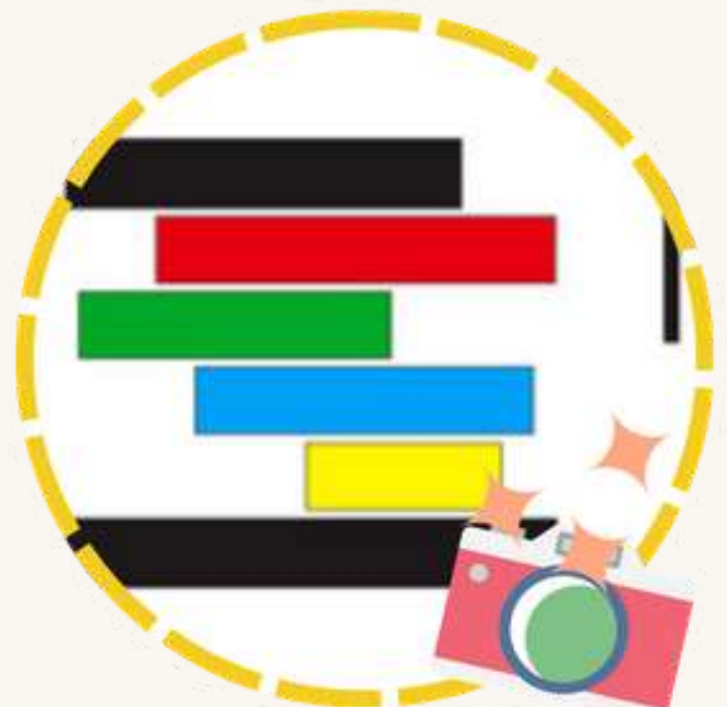
Kfé Fotos Avec Photographies Rencontres 11 juin · 19h · Gratuit