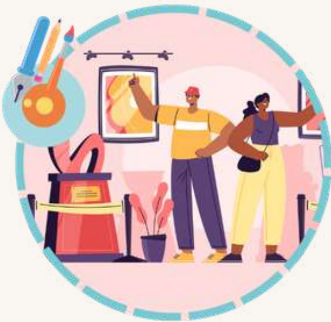
Vernissage Exposition Dessin-Peintures Expo du 4 au 19 juin 17 juin · 19h · Gratuit